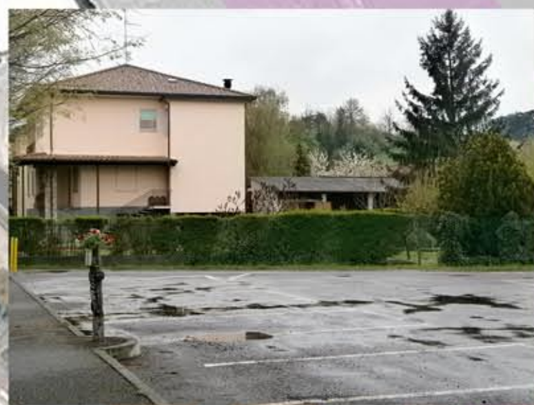
Foto fabbricati adiacenti al valore minimo della fascia di rispetto pari a 38 m.

PARERI ENTI SOVRAORDINATI PARERE PREVENTIVO ARPA ARPA Lombardia, Dipartimento provinciale di PAVIA, Via Nino Bixio, 13; 27100 - PAVIA Serv. Igiene Sanità - Dirigente responsabile D.sso Lia Broglia PARERE PREVENTIVO AUL AZIENDA SANITARIA LOCALE DELLA PROVINCIA DI PAVIA Viale Indipendenza, 3 - 27100 Pavia Serv. Igiene Sanità PARERE PREVENTIVO Soprintendenza per i Beni Architettonici e per il Paesaggio Soprintendenza per i Beni Architettonici e per il Paesaggio della provincia di Milano Palazzo Reale - Piazza del Duomo, 14 - 20122 Milano Il Soprintendente Arch. Alberto Artoli - Funzionario responsabile Arch. Paolo Savio